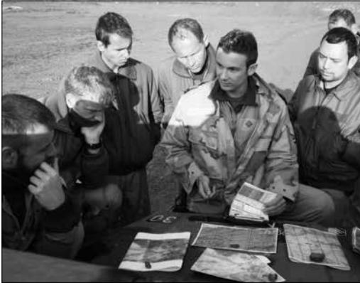
Ochtendbriefing in Afghanistan.

wielen in de rivier hangen om de Afghanen op te vissen. Dat waren mooie klussen, want ondanks de taalbarrière kon je de dankbaarheid van die mensen van hun gezichten aflezen.” „Over taalbarrière gesproken: bepaalde gebaren zijn daar anders. Het gebaar ‘kom hier’ betekent daar juist ‘ga weg’! Wel handig om te weten als je een reddingsoperatie uitvoert. Het duurde even voor we dat doorhadden.”