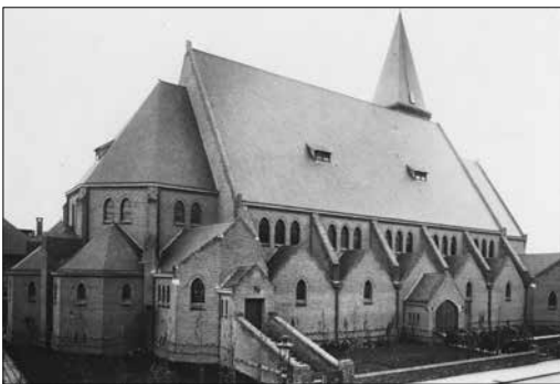
De Sacramentskerk gezien vanaf de achterkant aan de Sijzenlaan, kort na de bouw in 1926.

De wijkvereniging werpt zich terecht op als spreekbuis van de bewoners. Zij heeft al kenbaar gemaakt zich met alle mogelijke middelen te zullen verzetten als met haar eisen geen rekening wordt gehouden. Daarmee reageert de wijkvereniging op een door de projectontwikkelaar Kavel Vastgoed BV ingediende beginselaanvraag bij de gemeente. De wijkvereniging is teleurgesteld in de gemeente en de projectontwikkelaar omdat er met haar suggesties niets gedaan is. De vraag is hoe dit gezien moet worden in het licht van de toezeg-